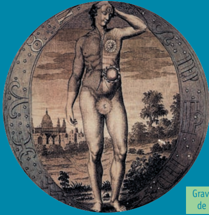
Gravure de 1764 de D. A. Freher

J'aime nommer l'attention "Présence d'Esprit", car il s'agit bien là d'un esprit présent dont le feu illumine toute chose, Hic et Nunc.