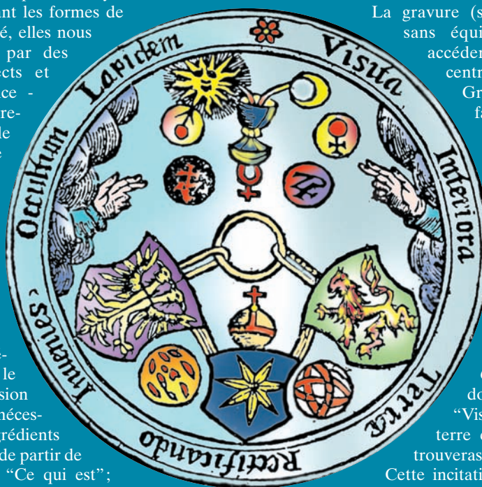
Schéma 1 : Paradigme de la Table d'Émeraude

Visite vient du latin visitare , forme de visere qui signifie "voir". La première étape de ce chemin est bien celle de la vision, synonyme de pleine conscience dans ce contexte; vision qui ne peut exister sans une attention vigilante appliquée à l'intérieur de cette terre dont il est important de connaître la nature.